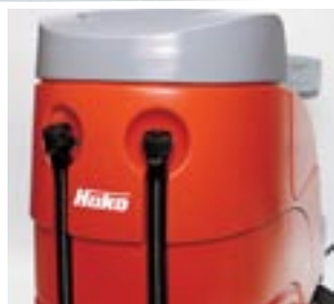
Lättskött Förvaringskorg ovanpå maskinen. Bekväma, doserbara ventiler på tömningsslangarna för lätt och bekväm tömning.