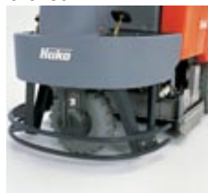
Smidig Vändradie endast 83 cm! Möjligt genom avrundad bakdel och framhjulsdraft med 90° hjulutslag åt båda hållen.