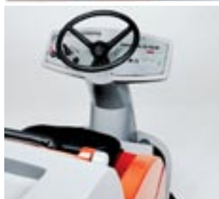
Tydlig manöverpanel Bekväma förarstol med lättgående styrning. Skurborstarna är skyddade av kollisionsbåge.