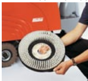
HAKO-vattenspar-ringar Mod. "RD": 50% inbesparing av vatten och rengöringsmedel. Testat och bekräftat av fristående provningsanstalt!