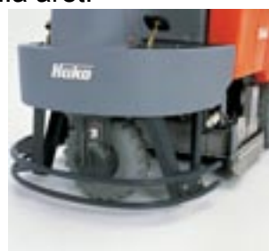
Smidig Vändradie endast 83 cm! Möjligt genom avrundad bakdel och framhjulsdraft med 90° hjulutslag åt båda hållen.