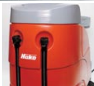
Lättskött Förvaringskorg ovanpå maskinen. Bekväma, doserbara ventiler på tömningsslangarna för lätt och bekväm tömning.