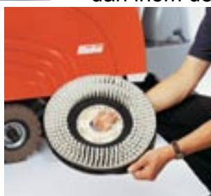
HAKO-vattenspar-ringar Mod. "RD": 50% inbesparing av vatten och rengöringsmedel. Testat och bekräftat av fristående provningsanstalt!