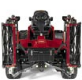
Smal transportbredd för enkel åtkomst till arbetsområden/vägarbeten

Den helt inglasade hytten för alla vädertyper, som finns som tillval, har en certifierad störtbåge, ger maximal sikt samt en säker och bekväm arbetsmiljö. Luftkonditionering och uppvärmningssystem finns också att tillgå, och erbjuder föraren ökat skydd i alla väder. Hytten kan lutats framtill vilket underlättar vid service.