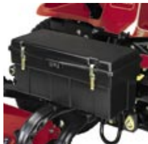
Stor verktygslåda för förvaring