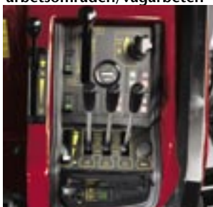
Ergonomiska reglage för förarkomfort