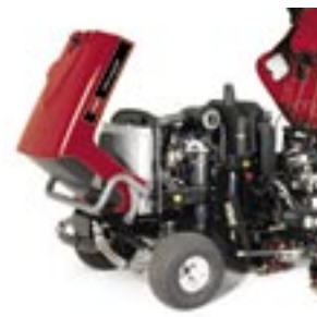
Lätt åtkomst till motorn för dagligt underhåll