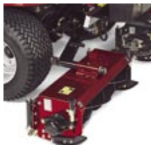
Förstärkta kommersiella klippenheter