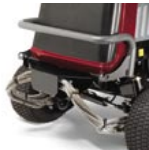
Robust, förstärkt bakaxel för extra hållbarhet