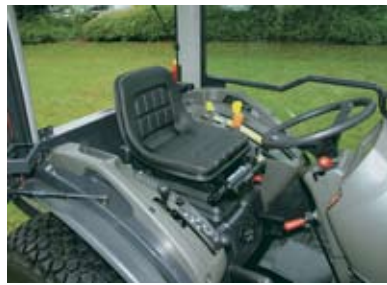
Alla reglage är tydligt markerade och placerade för enkel användning. Förarsitsen har flera justeringsmöjligheter.