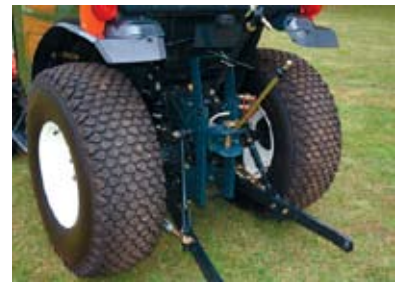
3-punktslyft med lyftkraft på 1000 kg. Verksfri justering av dragets höjd. Gaffel eller kulkoppling.