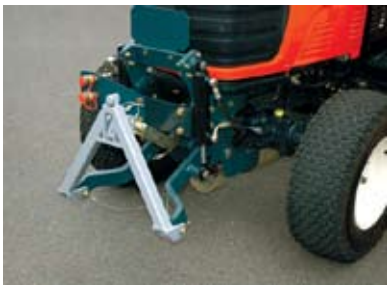
Frontlyft med A-ram. Lyftkraft på 700 kg. Två dubbelverkande hydraulcylindrar, integrerat kraftuttag fram.