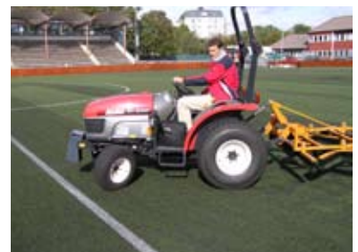
Hakotrac med öppen förarplats.