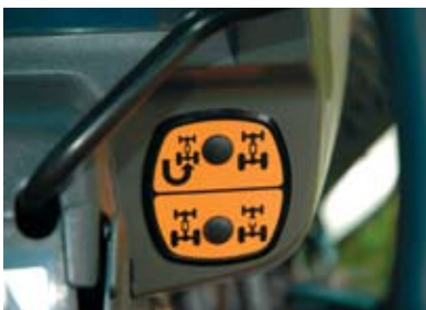
Fyrhjulsdrift som kan aktiveras under belastning. Tvåfartsfunktionen skyddar gräsytan vid skarpa svängar.