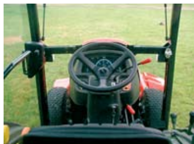
Bra överblick över de bekvämt placerade reglagen. Stora rutor och bra sikt från förarplatsen.