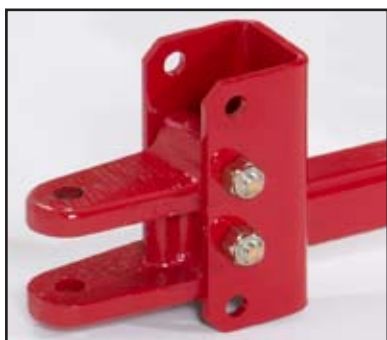
Förstärkt dragkrok som kan justeras i tre lägen