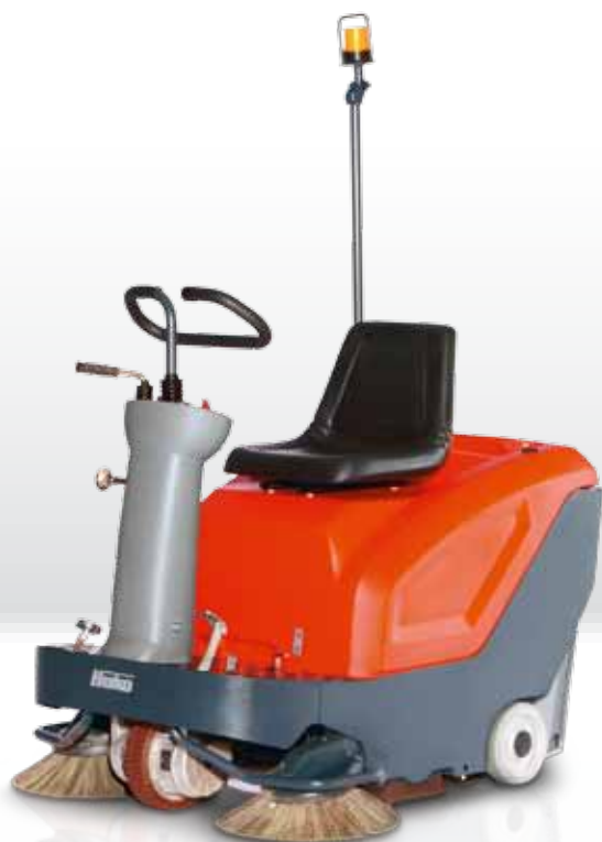
Sweepmaster B800 R