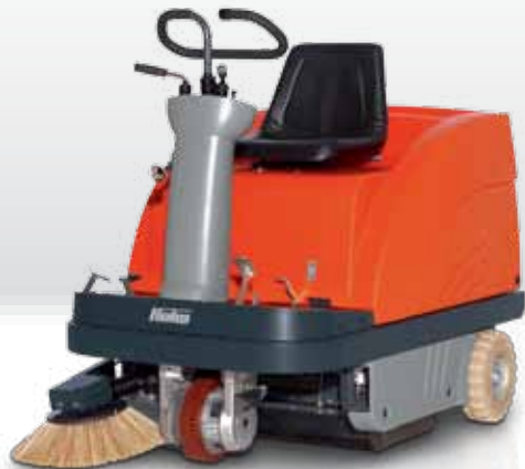
Sweepmaster B900 R