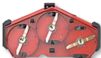
(A) (B) (C)