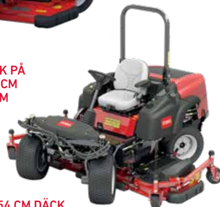
GM360 – 254 CM DÄCK