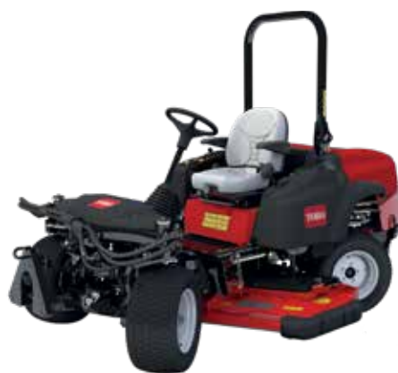
GM360 – DÄCK PÅ 152 CM/157 CM OCH 183 CM