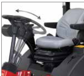
STYRKOLONN Styrkolonn med justerbar lutning