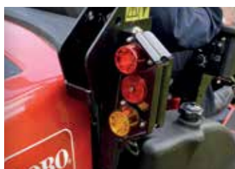
LED-LAMPSATS MED BROMSLJUS