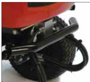
KROCKRAM Bakre kofångarstäng skyddar mot stötar bakifrån