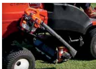
FÄSTE FÖR HANDBUREN LÖVBLÅS