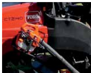
Fäste för handburen lövblås