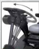
Styrkolonn med justerbar lutning