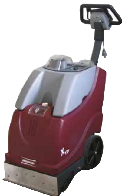
Clean X17 Eco