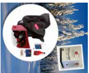
Komplett Snökit för 2-stegsslungor (Överdrag samt kit med: olja, tändstift, bensinstabilisator och brytbullar)