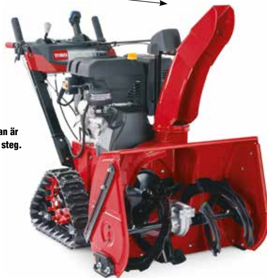
Snöslungan är tiltbar i 4 steg.

Alla Toro Power Max snöslungor är utrustade med robusta utkastarrör i slitstarkt stål.